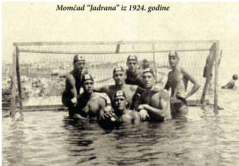
Momčad "Jadrana" iz 1924. godine