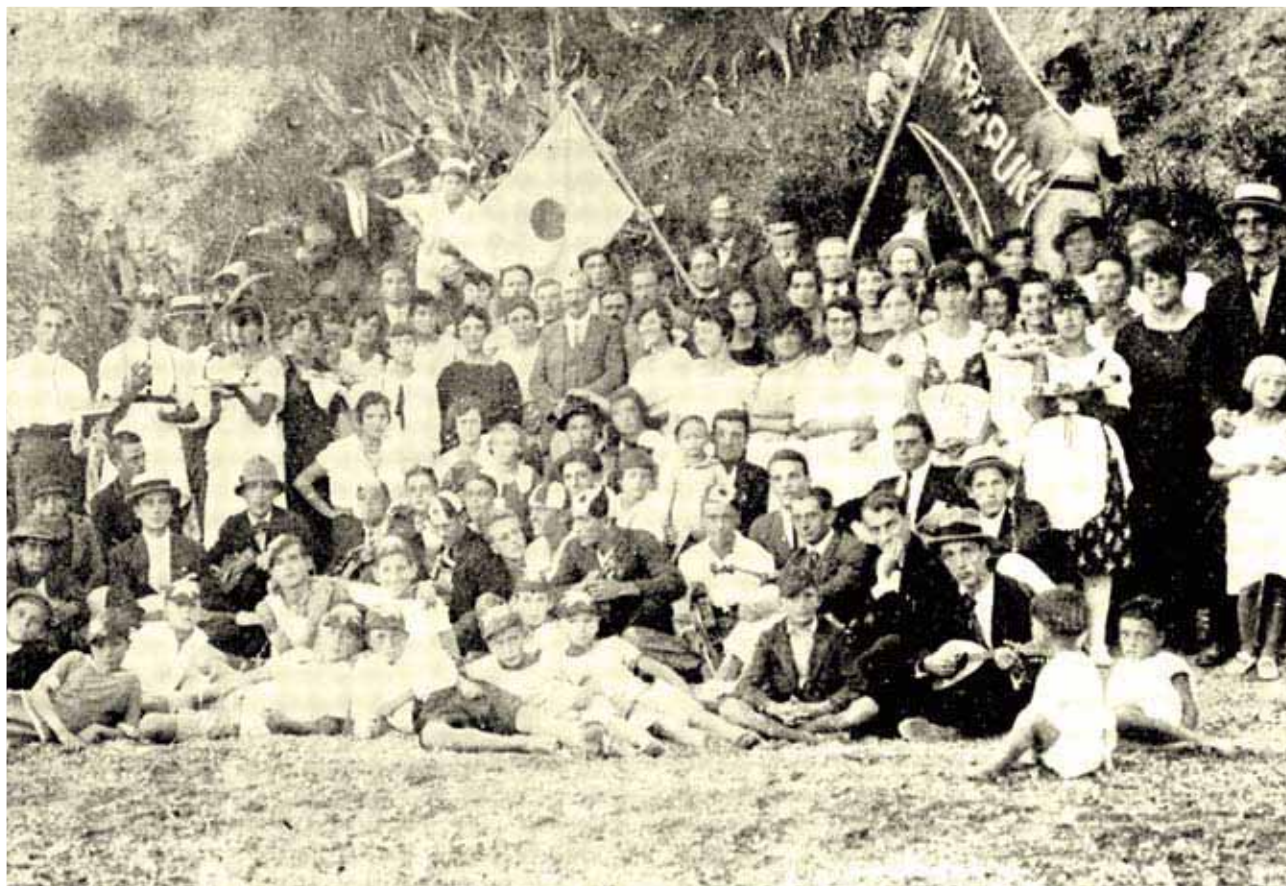
Članovi republika "Baluni" i "Mali puk" (1920.)